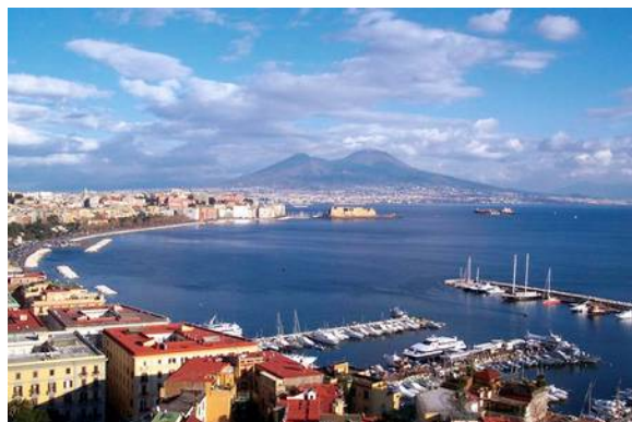
ナポリ湾からヴェスヴィオ山を望む

カンツォーネの中で最も有名な”オ・ソーレ・ミーオ 私の太陽”は、恋人を青い空にさんさんと輝く太陽にたとえた情熱的な愛の歌です。イタリアの第二の国歌ともいわれます。